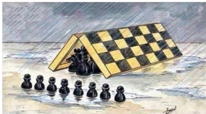
Figura 02 - Sociedade e suas Desigualdades