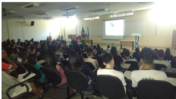
Figura 01 - Alunos no auditório participando da atividade