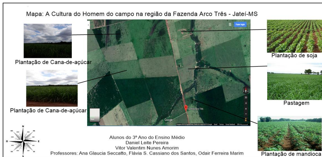
Figura 2 - Trabalho desenvolvido por estudantes do 3º Ano do Ensino Médio, intitulado de “A cultura do homem do campo na região da Fazenda Arco Três – Jateí-MS”.