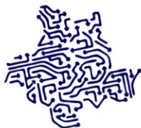
Figura 1: Primeiro episódio GeoNaVida.