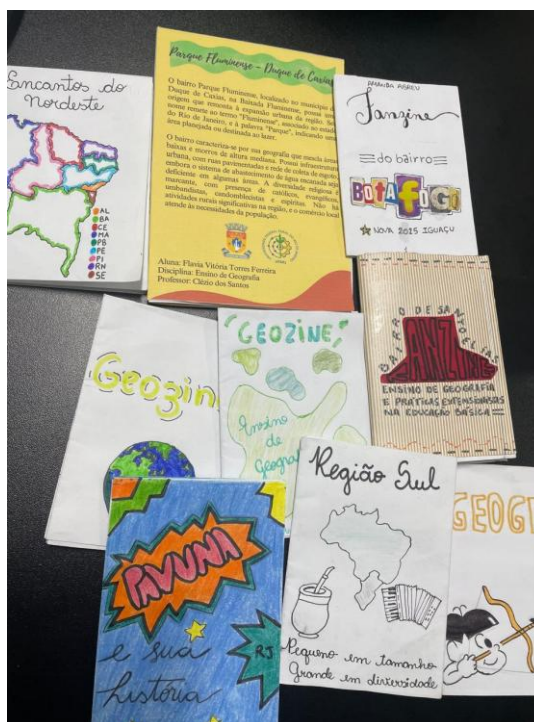
Figura 01. Capas de fanzines construídos por alunos/as de licenciatura em Geografia do IM/UFRRJ com técnicas simples

Na mesma figura, vemos fanzines que abordam regiões brasileiras, como a Região Nordeste e a Região Sul. Todos foram construídos no formato ¼ de ofício.