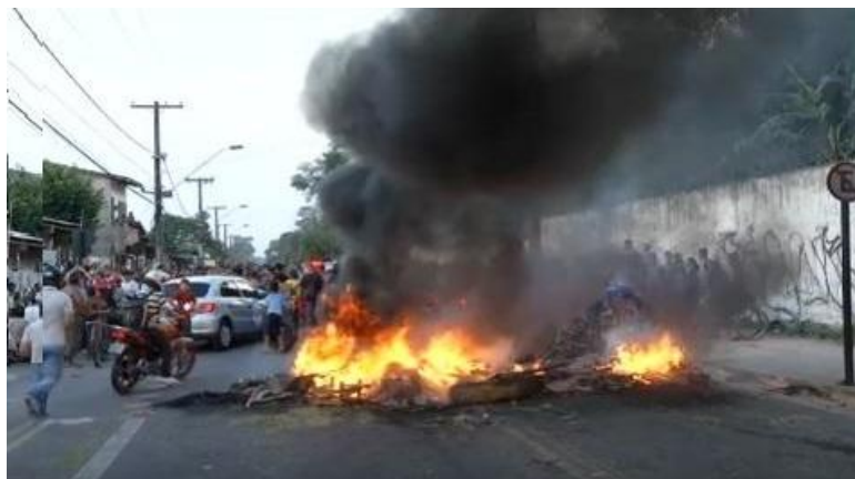
Figura 4 - Protesto por abastecimento de água no bairro Pratinha.

com a finalidade de chamar a atenção do poder público para a falta de saneamento básico na área, do qual o abastecimento de água potável faz parte. Assim, os moradores de várias ocupações espontâneas interditam as principais vias como as rodovias Arthur Bernardes e do Tapanã a fim de sensibilizar a prefeitura para este problema que tanto afeta a vida dessas populações. Outras vias menores também às vezes são fechadas como forma de protestos (Figura 4).