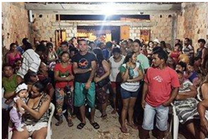
Figura 3 - Reunião de conciliação entre moradores da ocupação Visão de Deus e a empresa Porto Rico.

intermediação do Estado, através da Defensoria Pública realizam negociação direta com os proprietários da terra para não serem retirados do terreno como ocorreu na ocupação Visão de Deus no bairro da Pratinha. Essa ocupação teve início em 2010. A empresa Porto Rico, proprietária do terreno, conseguiu a reintegração de posse. Porém, meses depois a terra voltou a ser ocupada. Em maio de 2016, sob a intermediação da Defensoria Pública do Pará, entraram em acordo com a empresa proprietária para permanecerem no local através do pagamento, por parte de cada morador, de pequenas parcelas mensais (Figura 3).