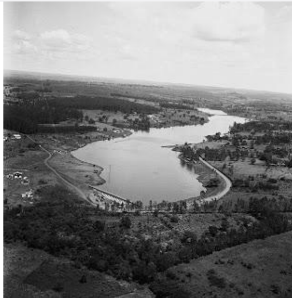
Figura 2- Lago Igapó.

É possível visualizar que ao redor da represa existam propriedades rurais, e nenhuma construção significativa, ao observar a figura 3 em direção ao lado esquerdo na margem esquerda do lago pode-se verificar que exatamente nesse espaço que muito tempo depois, principalmente após a década de 1990, irá surgir a Gleba Palhano, trazendo para essa região uma forte verticalização com intensa pavimentação.