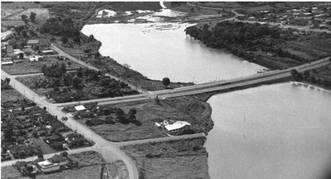
Figura 3- Lago Igapó 1975.

É possível visualizar que ao redor da represa existam propriedades rurais, e nenhuma construção significativa, ao observar a figura 3 em direção ao lado esquerdo na margem esquerda do lago pode-se verificar que exatamente nesse espaço que muito tempo depois, principalmente após a década de 1990, irá surgir a Gleba Palhano, trazendo para essa região uma forte verticalização com intensa pavimentação.