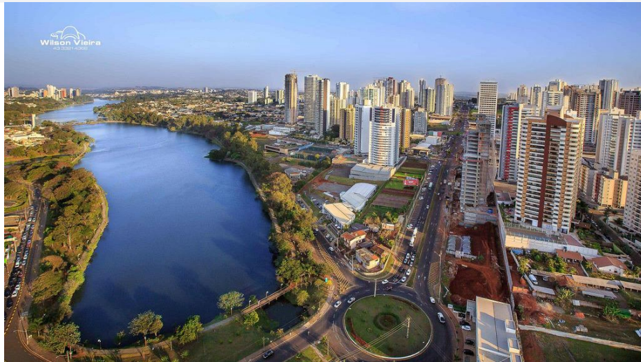
Figura 5- Imagem da Avenida Airton Sena, Fonte: Wilson Vieira,

Assim, considerando o crescimento urbano, as devidas construções e edificações nas margens da bacia do ribeirão Cambé, principalmente na região da represa, temos como um dos problemas a ser discutido a impermeabilização do solo, sendo este um dos principais agentes causadores de enchentes, pois com a impermeabilização do solo se entende que passa há existir um processo de infiltração totalmente diferente daquele presente na área antes da pavimentação. Pois o solo perde a capacidade de recarga do lençol freático, uma vez que, uma área que poderia ser uma área de recarga de nascente, ao ser pavimentado perde sua capacidade de drenagem e essa água que infiltraria no solo perfaz outro curso percorrendo a superfície impermeabilizada e acaba por contribuir com eventos de formação de enxurradas e possíveis enchentes que causam grandes transtornos, principalmente em vias de grandes acessos como é o caso das vias que circundam o Lago Igapó, pois são vias que dão acesso a comércios, residências, faculdades, entre outros, assim: