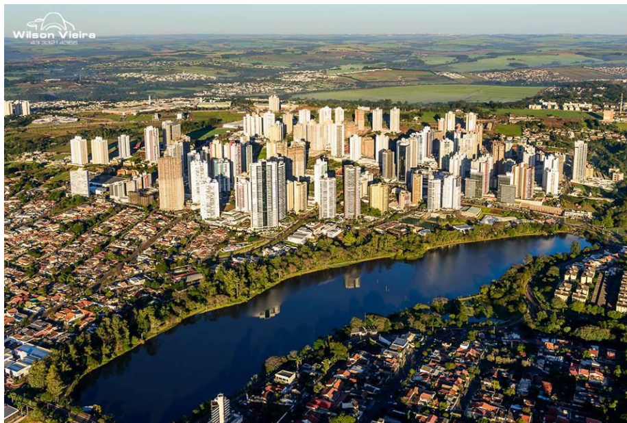
Figura 4- Imagem dos edifícios e das construções ao redor do lago.

Nas figuras 4 e 5, a seguir pode-se entender como essa região cresceu vertical e horizontalmente nos últimos anos, inclusive com um aumento significativo do trânsito e que corroborou para implantação de outra importante avenida, a avenida Airton Sena, que pode ser vista na figura 5. Essa juntamente com a avenida Higienópolis contribuem para dar vazão para o intenso tráfego da região.