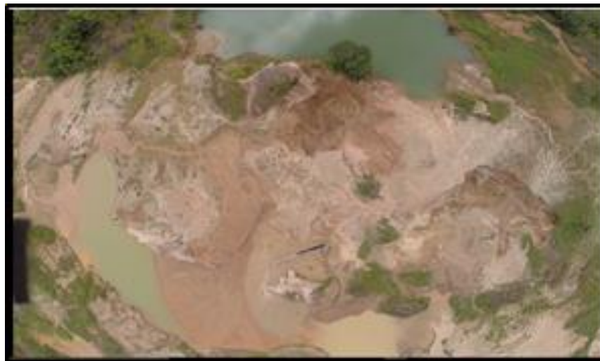
Figura 3- Deterioração ambiental e mudança da paisagem

- Meio Biótico: Neste meio percebe-se a ausência de animais e aves, pois a presença humana e os ruídos e barulho dos motores nos barrancos condicionam a migração de aves e mamíferos, e o ato de minerar na área chega a causar interferências na morfologia dos vegetais provocando ainda, degradação visual da paisagem (Figura 3 e 4).