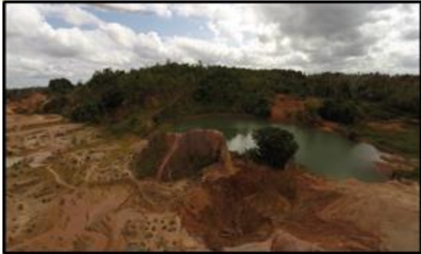
Figura 4- Área minerada e reflexos na mudança da paisagem.

- Meio Antrópico: para o meio antrópico, foram identificados impactos positivos e negativos. Os positivos estão ligados à geração de emprego e renda, o que possibilita uma oportunidade para a sobrevivência de trabalhadores garimpeiros e suas famílias, mesmo que tal atividade realizada no garimpo seja exercida como informal e de forma clandestina. Quanto aos impactos negativos, pôde-se diagnosticar: a) condições insalubres de trabalho (figura 5 e 6), uma vez que estão expostos ao sol, a água, poeira e contato sem nenhuma precaução com o mercúrio; b) o uso de mercúrio na atividade expõe trabalhadores a grandes riscos de saúde; c) Risco de morte por desmoronamento de barrancos.