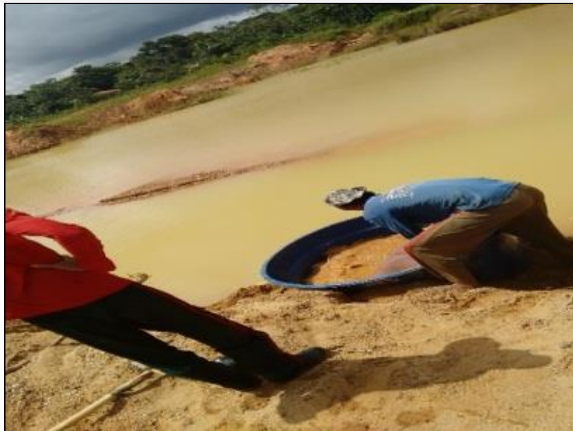
Figura 6- Condições de trabalho de garimpeiro

Nota-se que os reflexos da degradação ambiental em áreas de garimpo podem ser observados no conjunto da paisagem e em todos os seus elementos como o solo, fauna, flora e na geomorfologia. Assim, as mudanças que ocorrem no meio físico geram grande impacto no ambiente minerado.