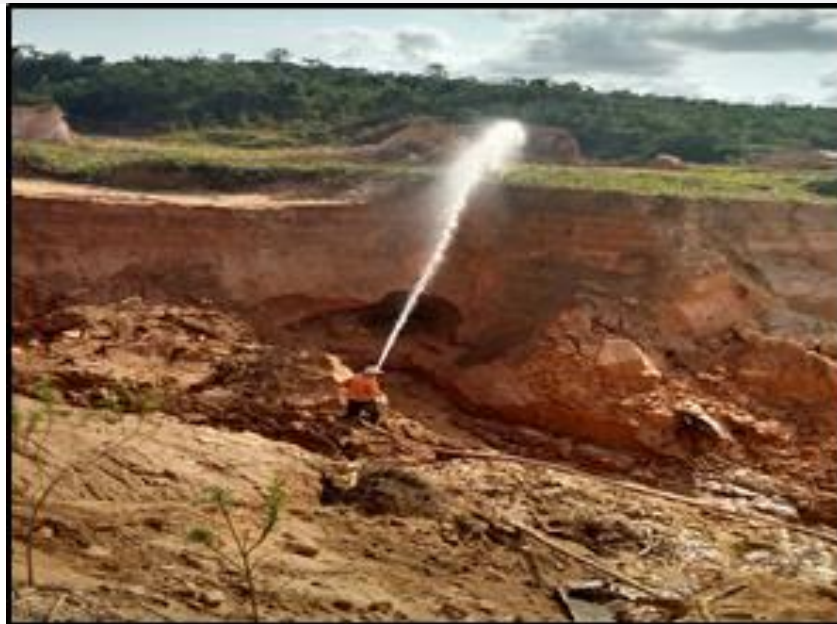
Figura 2- Atividade de garimpagem- desmoronamento de barranco

- Meio Biótico: Neste meio percebe-se a ausência de animais e aves, pois a presença humana e os ruídos e barulho dos motores nos barrancos condicionam a migração de aves e mamíferos, e o ato de minerar na área chega a causar interferências na morfologia dos vegetais provocando ainda, degradação visual da paisagem (Figura 3 e 4).