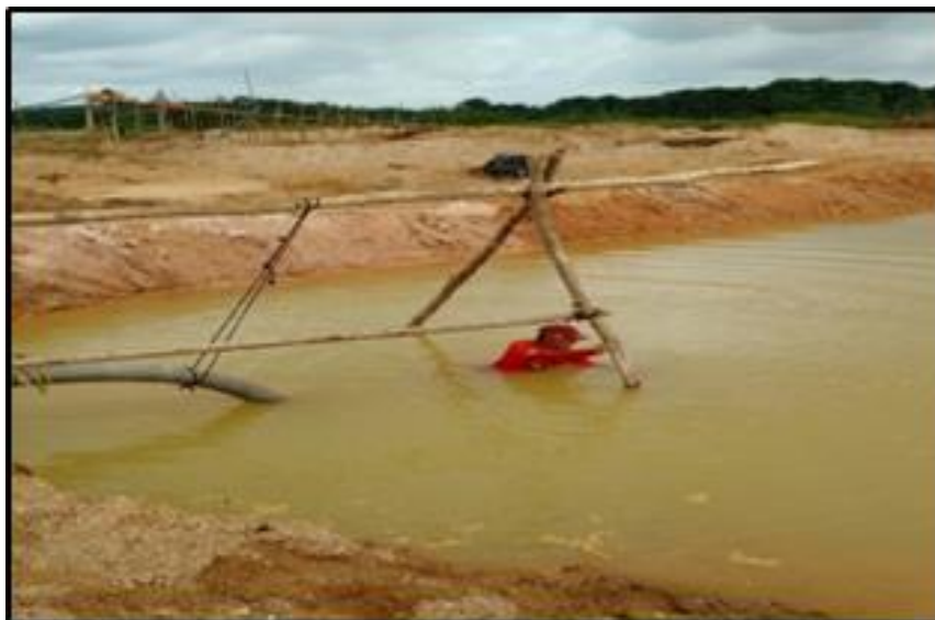
Figura 5- Trabalhador em condição insalubre de trabalho.

- Meio Antrópico: para o meio antrópico, foram identificados impactos positivos e negativos. Os positivos estão ligados à geração de emprego e renda, o que possibilita uma oportunidade para a sobrevivência de trabalhadores garimpeiros e suas famílias, mesmo que tal atividade realizada no garimpo seja exercida como informal e de forma clandestina. Quanto aos impactos negativos, pôde-se diagnosticar: a) condições insalubres de trabalho (figura 5 e 6), uma vez que estão expostos ao sol, a água, poeira e contato sem nenhuma precaução com o mercúrio; b) o uso de mercúrio na atividade expõe trabalhadores a grandes riscos de saúde; c) Risco de morte por desmoronamento de barrancos.