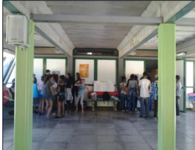
Figura 6 – Alunos analisando os mapas para a atividade “Caça ao tesouro”.