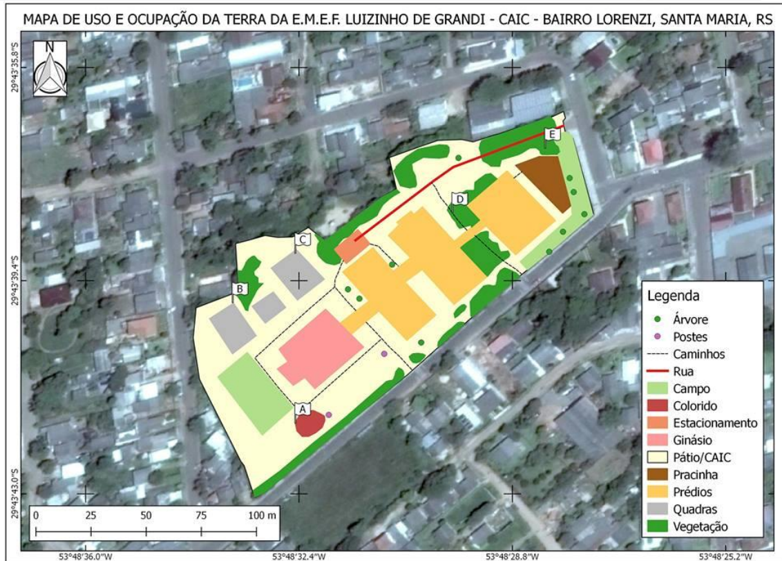
Figura 5 – Mapa da E.M.E.F. Luizinho de Grandi (CAIC) para o jogo “Caça ao tesouro”

Primeiramente, as equipes analisaram o mapa, bem como identificando os objetos pertencentes na escola na representação. Em seguida, as equipes dividiram seus integrantes em trios, a qual cada trio deveria ir um por vez, de acordo com o mapa, ao encontro das bandeiras, ou seja, o primeiro trio escalado a encontrar a bandeira A, o segundo a B, e assim sucessivamente até encontrar todas as bandeiras, tornando a equipe campeã a que fizesse toda atividade em menos tempo.