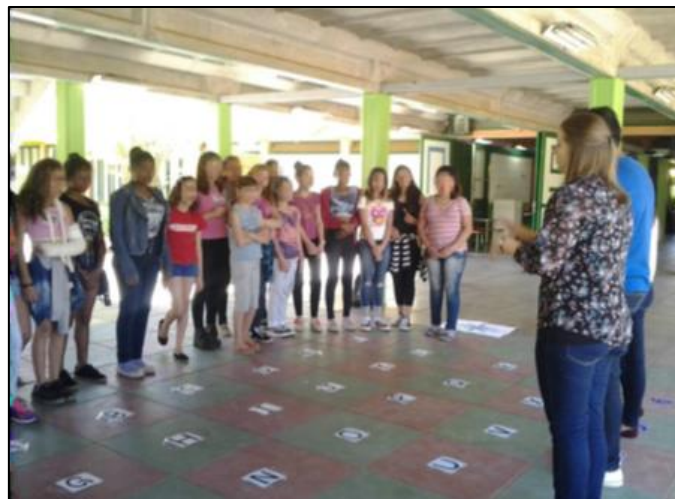
Figura 2 – Realização da prática sobre Lateralidade.

Convém destacar que, durante o desenvolvimento da atividade, observou-se que os alunos tinham conhecimentos prévios sobre a temática em relação com a mão que eles escrevem (direita ou esquerda). Dessa maneira, as perguntas realizadas foram de acordo com essa realidade, fazendo com que eles analisassem os objetos e colegas que estavam a sua direita e esquerda, pegando sempre como referencial o entendimento da mão deles, conforme a Figura 2. Diante disso, observou-se que a partir do questionamento se o colega estava a esquerda ou à direita, alguns alunos antes de responderem, acabavam olhando primeiramente para suas mãos.