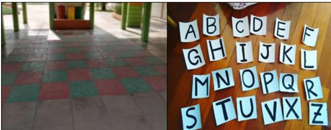
Figura 3 – Realização da prática sobre Lateralidade.

O jogo foi montado sobre um tabuleiro desenhado na parte externa da escola. Para identificação de cada casa pertencente ao tabuleiro, foi confeccionado em cartolina todas as letras do alfabeto e números de 1 a 6. Assim, esses números e as letras do alfabeto foram colados no tabuleiro para que servisse de referenciais sobre o andamento da atividade. A Figura 3 corresponde às letras e números confeccionados com finalidade de auxílio didático na atividade e o tabuleiro a qual foi aplicado a dinâmica