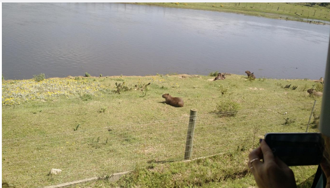
Figura 3 - Capivaras na Reserva Ecológica do Taim/RS.

Além disso, a Estação Ecológica do Taim, também é um importante berçário das aves migratórias, que viajam milhares de quilômetros de norte ao sul (Ártico e Antártida). A estação raramente sofre com a seca, pois as chuvas nessa região são abundantes e bem distribuídas, fazendo com que os ecossistemas funcionem com regularidade de precipitação, umidade e outros fatores climáticos.