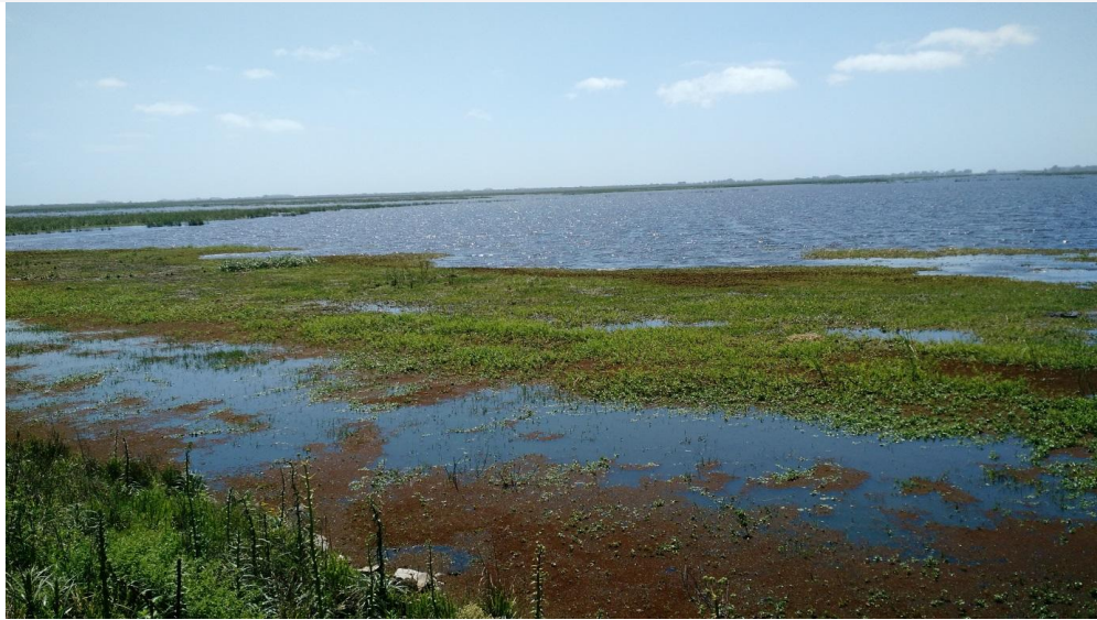
Figura 2 - Ecossistema na Estação Ecológica do Taim/RS.

De acordo com informações do Cadastro Nacional de Unidades de Conservação - Ministério do Meio Ambiente, 2017, a Estação Ecológica do Taim possui 220 espécies de plantas medicinais catalogadas, em torno de 322 espécies de aves, 28 espécies de mamíferos, 24 de répteis e 18 de anfíbios e conforme o mesmo referencial bibliográfico, segue a lista dos principais animais e seus nomes científicos encontrados nesta reserva: