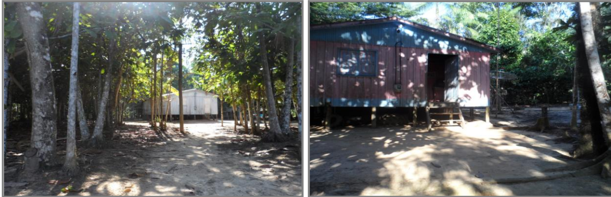
Figura 3 – Unidades habitacionais do ramal do Km 12

O comportamento dos moradores, com exposição mesmo nos horários mais intensos de transmissão, demonstra uma aceitação a condição em que estão inseridos. No ramal não há serviço de saúde, apenas é realizada a coleta de sangue para identificar a doença e tratá-la. Não há serviço preventivo como relatado ter ocorrido no ano 2014.