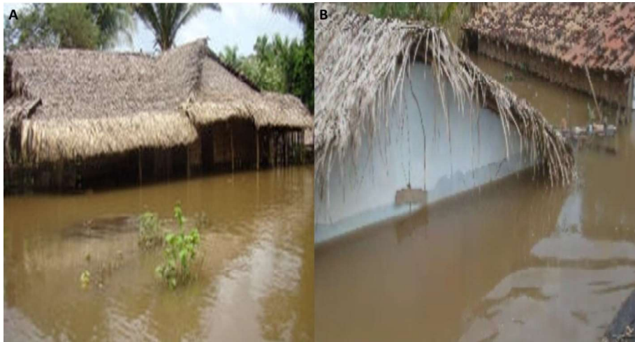
Figura 2 - Consequências da enchente de 2009 em Cantanhede: A e B - Casas tomadas pela água.

As enchentes como desastres naturais também foram pautas na mídia, em abril de 2009 o Jornal Pequeno divulgou que 500 pessoas em Cantanhede estavam desabrigadas e sem fornecimento de água, uma vez que a estação de captação foi destruída. Em maio do mesmo ano, o Jornal Pequeno trouxe informações que o nível do rio Itapecuru, em Cantanhede, estava 15m acima do nível normal (Figuras 2 e 3), e mais de 300 famílias já haviam sido retiradas dos povoados e levadas para abrigos. Estes fatos demonstram a vulnerabilidade, defendida aqui como, segundo Santos e Caldeyro (2007), uma comunidade, paisagem que se enquadra na condição de suscetível ao impacto de um evento.