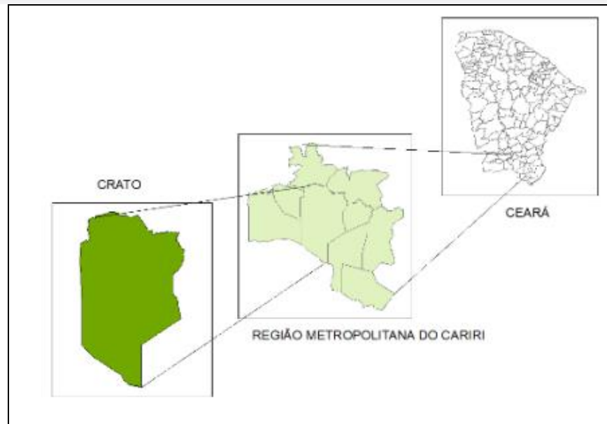
Figura 1. Localização do município do Crato/Ceará

O interesse de se trabalhar com esse tema partiu das observações das imagens de satélites da banda termal, na qual se verificou que as diferentes superfícies do solo poderiam interferir diretamente na temperatura de superfície. A pesquisa tem como objetivo analisar as diferenças térmicas da superfície zonal urbana do município do Crato para o ano de 2016, através de imagens do satélite LANDSAT 8TM, BANDA 10 (termal) e correlacionar com os diferentes tipos de uso e ocupação da cidade. Segundo Silva (2015), “a temperatura de superfície é medida a partir da energia emitida pelos objetos terrestre e captada pelos sensores”. Gartland (2010) “reforça que as temperaturas de superfície são bem mais variantes do que as temperaturas de ar ao longo do dia, pois as superfícies urbanas como calçadas e coberturas, são aquecidas rotineiramente pelo sol”.