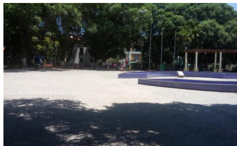
Figura 3 - Praça da Sé