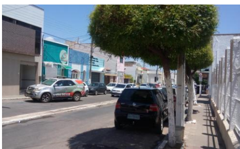
Figura 2 - Rua Cristão Gonçalves

Na imagem de satélite Sentinel 2A com resolução de 10 metros como mostra a figura 4, observa-se uma maior concentração de edificações nos bairros que apresentaram maiores valores de temperatura de superfície. No Parque Recreio apesar da presença de áreas verdes relacionadas aos corpos hídricos do rio da Batateiras, em muitos locais tem-se solo exposto o que ocasiona valores altos de temperatura, mesmas condições apresentadas em outros bairros, como o Barro Branco e Mirandão, este último apresenta algumas áreas que são loteadas, por isso, devido ao solo desnudo, os valores de temperatura apresentaram-se maiores.