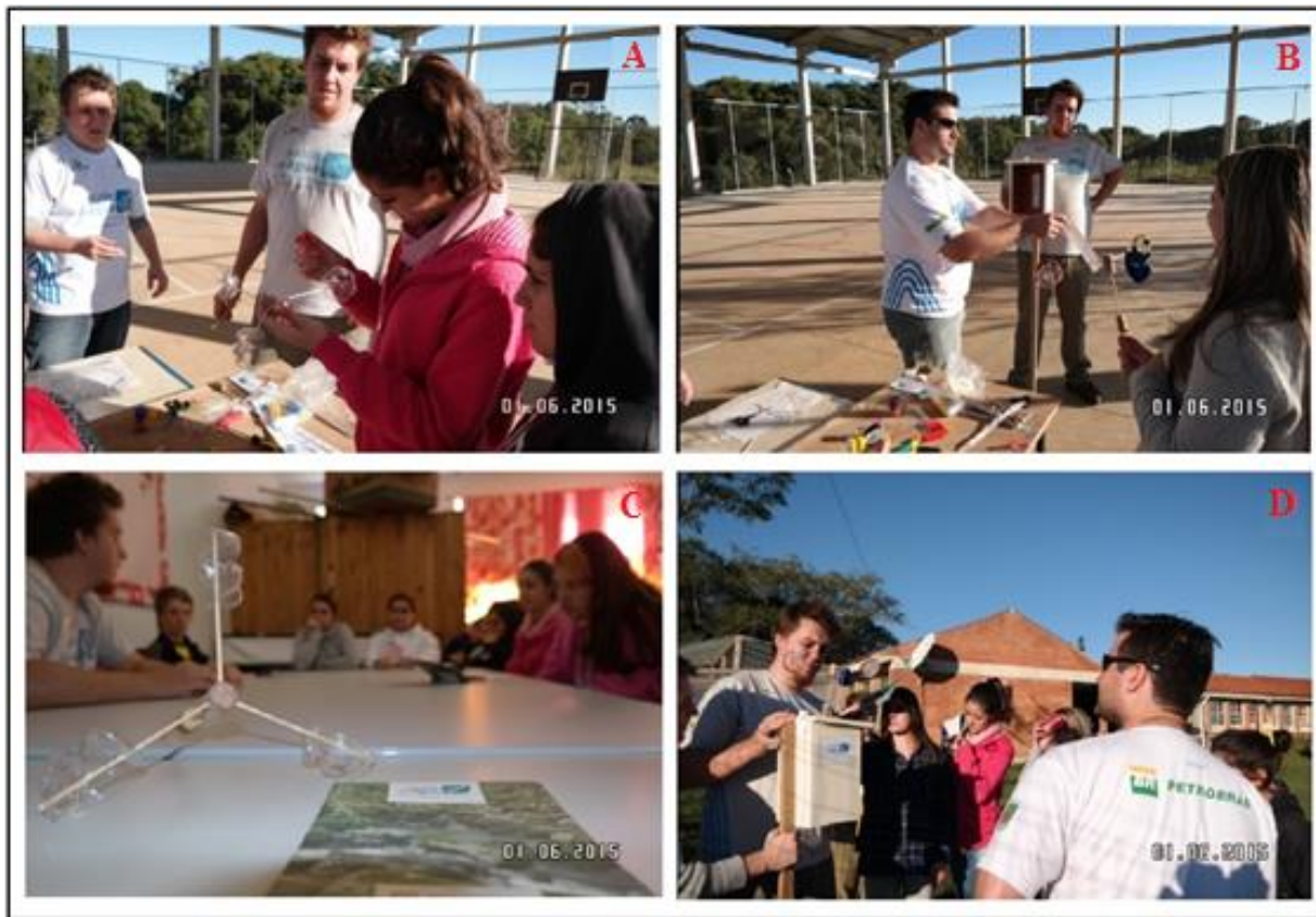
Figura 3 - Construção do anemômetro: Desenvolvimento (A e B) e finalizado (C e D).

Nesta etapa o uso de recursos práticos favoreceu a participação e interesse por parte dos alunos, que ajudaram em todas etapas da confecção dos instrumentos meteorológicas e também da instalação do abrigo meteorológico. Na figura (3) é apresentada a construção do anemômetro e na figura 9 é representada a figura do barômetro.