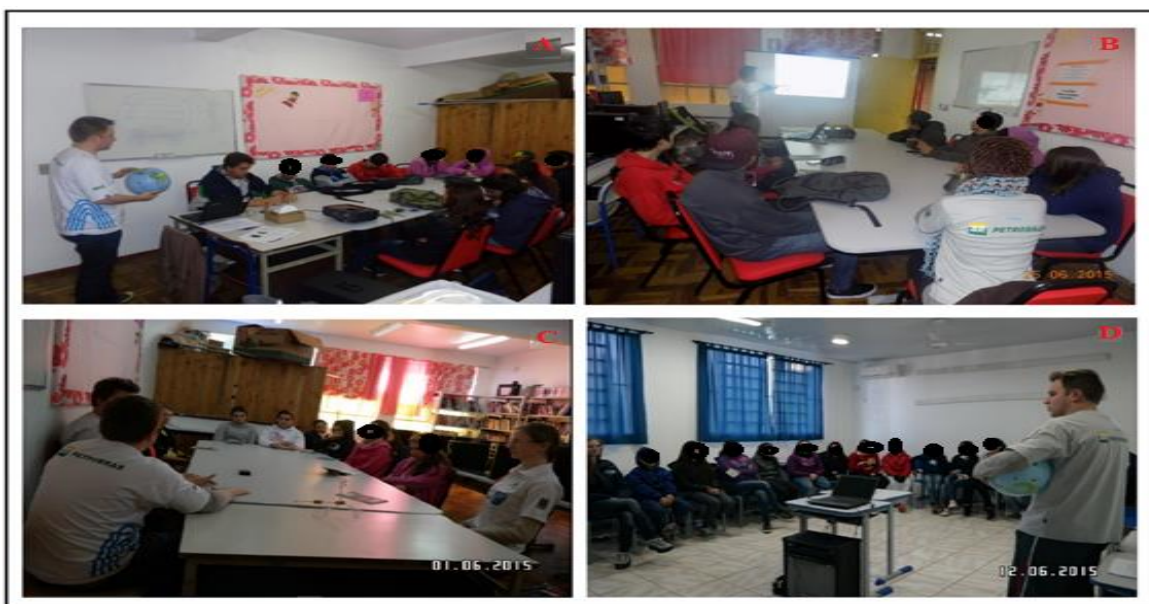
Figura 2 - Aula Teórica: Alunos da Escola Alfredo Lenhart (A e B) e Alunos da Escola Itaara (C e D)

Na primeira etapa, na qual foi concedida aula teórica para os alunos, sobre os fenômenos e elementos atmosféricos de forma geral e conceitos entre tempo e clima. Deste modo foi observado que a maioria não tinha conhecimento sobre os conceitos abordados. Desta maneira, a pratica teórica contribuiu para seguimento do trabalho. A aula teórica é demonstrada na figura (2) abaixo.