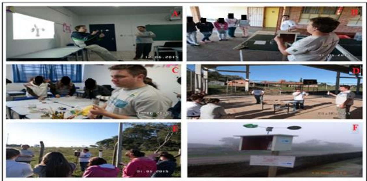
Figura 4- Confeccção da miniestação meteorológica: Confeccção ( A, B, C e D) e Instalação (E e F)

A última etapa prática foi construção e instalação da estação meteorológica (figura 4) nos pátios de ambas escolas em terreno que possuía cobertura vegetal a fim de diminuir a relação, com sua frente voltada ao sul magnético a fim de não incidir diretamente os raios solares. O termômetro de mercúrio para medição da temperatura e o pluviômetro, foram ambos comprados pela fundação MO'A e respectivamente instalados parte de dentro e fixado na parte de trás da estação.